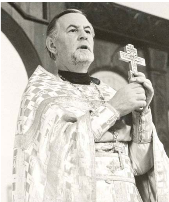
прот. Александр Шмеман

Оно есть Логос, что по-гречески значит «смысл» и «разум». А разве не сказано в Евангелии, что Он — Логос, смысл и разум всего? Еще несколько десятилетий — и перед нами другой представитель античного Олимпа — Климент Александрийский, И к нему тоже христианская вера приходит и раскрывается как вершина разума, как предел и исполнение всех исканий, всех чаяний человеческих. И сколько их, подобных Иустину и Клименту. И, нако-