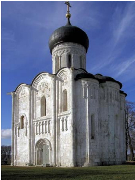
Храм Покрова Божией Матери на Нерли (12 век)

Строительство Святой Софии способствовало и развитию представления о храме как об образе космоса, где купол изображает небесный свод, а все пространство символизирует населенную вселенную — мир видимый и невидимый. Связь между храмом и