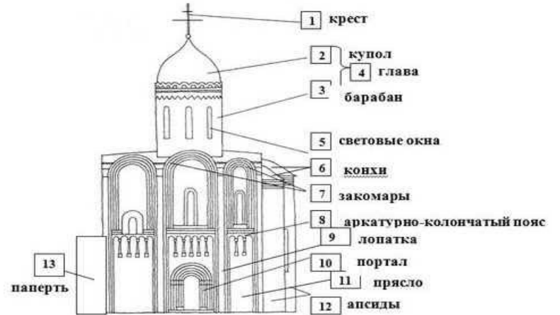
Крестово-купольный храм (схема)

Формы деревянных храмов оказали влияние на каменное (кирпичное) строительство. Стали строить затейливые каменные шатровые церкви, напоминавшие огромные башни (столпы). Высшим достижением каменной шатровой архитектуры по праву считается Покровский собор в Москве, более извест-