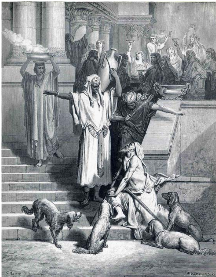
Богач и Лазарь. Густав Доре, 1891 г.

Святитель Иоанн Златоуст говорит, что этот безумный богач имел все сокровище вселенной у себя под ногами. Ему достаточно было только наклониться к этому несчастному Лазарю, и протянуть руку помощи. И он обрел бы Самого Христа. Он же надменно раз за разом просил. Этот высокомерный гордец, который раньше только приказывал, вдруг просит. Несчастья и страдания даже из камней могут сделать людей. На просьбу этого, теперь страдающего богача, Авраам так и отвечает, что никто не может