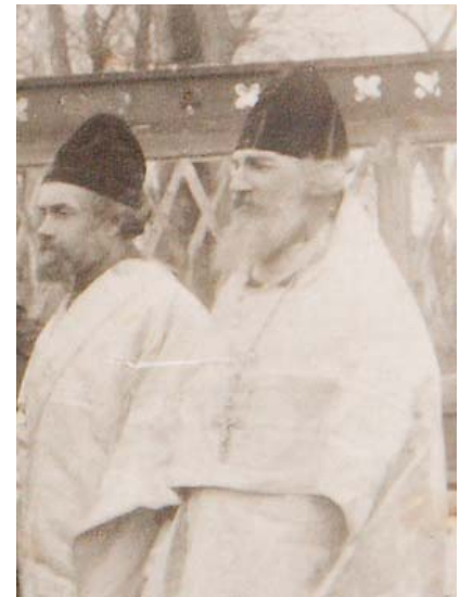
прижизненное фото о. Константина Успенского

25 НОЯБРЯ – ДЕНЬ МУЧЕНИЧЕСКОЙ КОНЧИНЫ СВЯЩЕННОМУЧЕНИКА КОНСТАНТИНА (УСПЕНСКОГО), ПРЕСВИТЕРА ВАСЮТИНСКОГО (+ 1937).