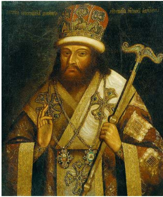
Святитель Димитрий Ростовский. Портрет начала XVIII века

Вступив в управление, свт. Димитрий нашел великие нестроения, касающиеся не только мирян, но и духовенства. Великую горечь у святителя вызывало пренебрежение к проповедованию Слова Божьего. Желая, чтобы иереи со страхом Божиим проходили служение, св. Димитрий стал заботиться о