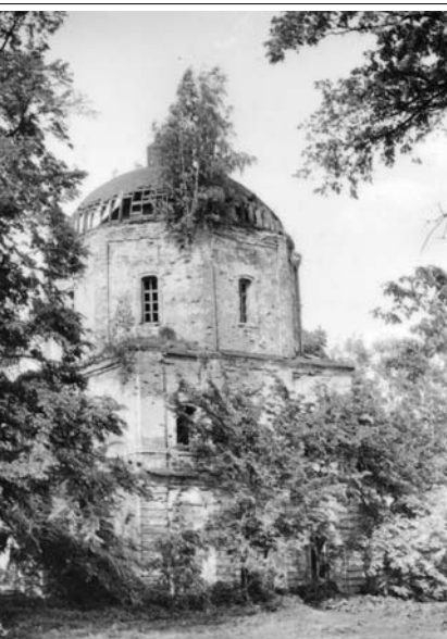
Руины Никольского храма в с. Васютино, май 1989 г.