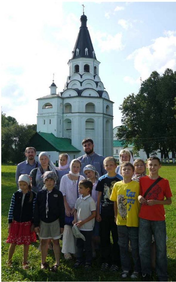
Участники лагеря во время поездки в г. Александров

ко светлее. Особенно дадут нам возможность понять, что подобные мероприятия наших впечатлений не просто необходимы в условиях современной жизни, а должны проводиться в обязательном порядке ежегодно и чаще. Ведь только здесь наши дети, и мы сами сможем по-настоящему научиться быть людьми в том смысле, в котором и создавал нас изначально Господь – умиению любить, отдавать, созидать, помогать, соучаствовать в жизни другого человека, сопереживать и трудиться. Давайте все вместе с Божьей помощью возрождать светлые, добрые, но, к сожалению, забытые в этом мире истины. Спашем теплотой атмосферы доброты, любви и Божьей помощи во всех начинаниях, соборная молитва, забота и помощь всех кто принимает активное участие в проведении этого лагеря,