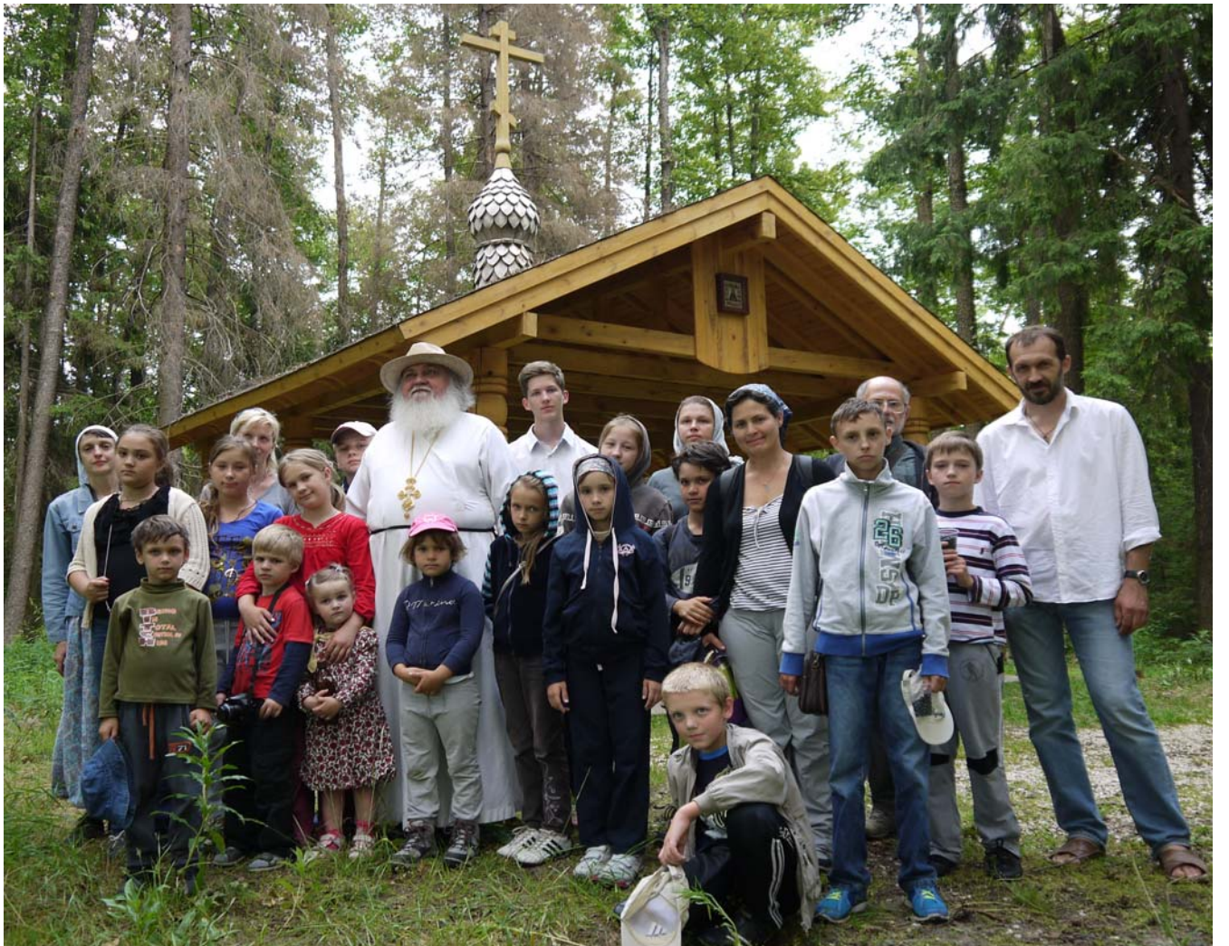
Участники лагеря на колодчике при. Сергия Радонежского

экскурсии - в Свято-Успенский женский монастырь г. Александрова и в Свято-Троицкий Стефано-Махрицкий женский монастырь произвели сильное впечатление на ребят и позволили окунуться в мир святости, послушания и того при-