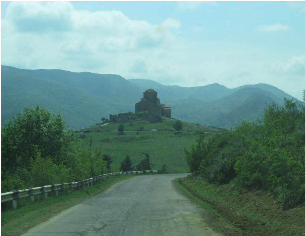
Джвари - грузинский монастырь и храм на вершине горы близ Мцхеты — там, где, по преданию, воздвигла крест святая равноапостольная Нина.

Джвари построен на крутом утесе, на самом краю скалы, сливаясь с ней и завершая ее, собирая воедино окружающие горы. Его видно со всех сторон с далекого расстояния, он ка-