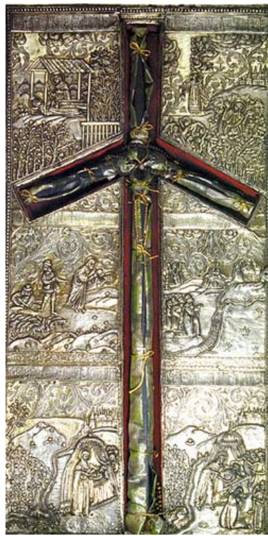
Крест святой Нины

Земля эта с давних пор была possession Святому Великому ченнику Георгию. Здесь насчитывалось до 365 (по числу дней в году) храмов, посвященных этому святому. Да и само происхождение названия Грузии, (иначе «Джорджия») говорит