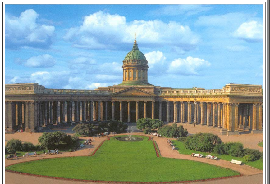
Кафедральный собор Казанской иконы Божией Матери в Санкт-Петербурге на Невском проспекте (архитектор А.Н. Воронихин)

«Аз, смиренный Ермоген, Божию милостию патриарх Богом спасаемого града Москвы и всея Руси, воспоминаю вам, прежде бывшим господием и братием, и всему священническому и иноческому чину, и бояром, и окольным, и дворяном, и дяком, и детям боярским, и гостем, и приказным людям, и стрельцом, и казаком, и всяким ратным, и торговым, и пашенным людем — бывшим православным христианом всякого чина, и возраста же, и сана. Ныне же, грех ради наших, софротивно обретесе, не ведаем, как вас и назвати: оставивши бо свет — во