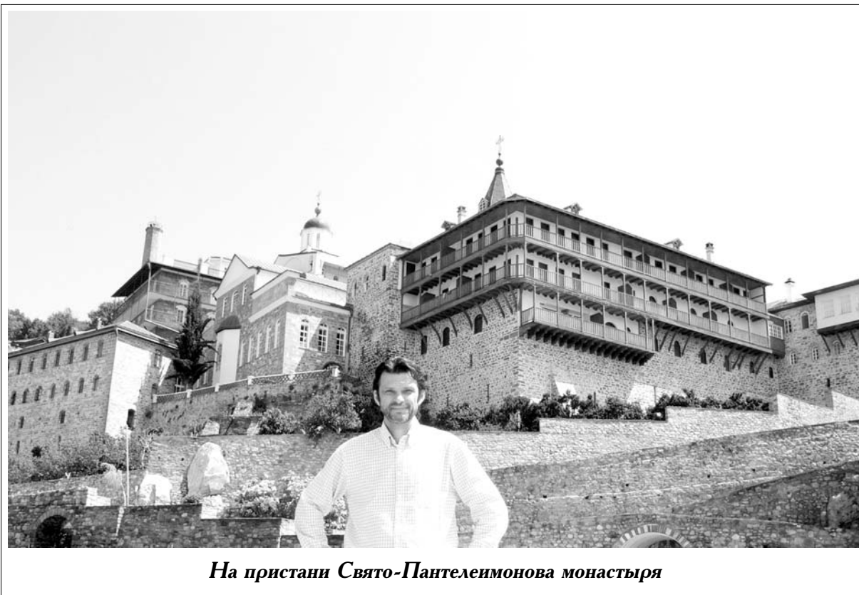
На пристани Свято-Пантелеимонова монастыря

Время трапезы ограничено, и заканчивается она также по звонку колокольчика. Если Вы не успели доест — это Ваши проблемы, вместе со всеми Вы обязаны встать из-за стола на молитву и покинуть трапезную. Отмечу еще одну очень трогательную и существующую только в русском монастыре традицию — первыми из-за стола выходят монахи, но по праздникам они не выходят сразу на улицу, а остановившись в дверях по обе стороны прохода, все во главе с игуменом в поклоне провожают выходящих из трапезной паломников и только потом поки-