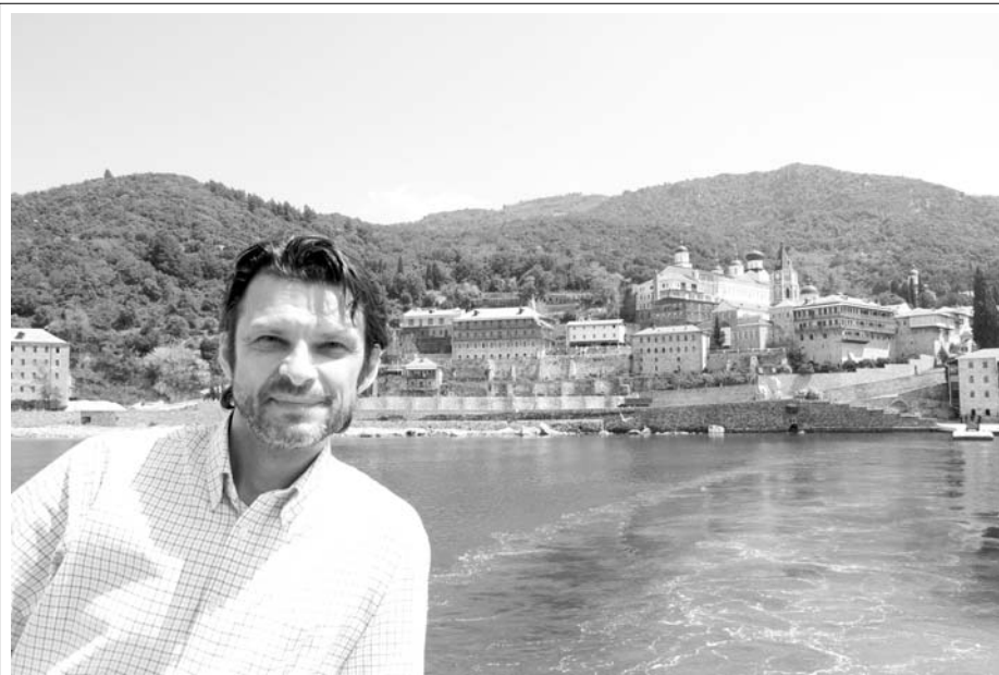
Свято-Пантелеимонов монастырь (вид с моря)

Вернувшись из своей продолжительной поездки, игумен не только не похвалил, а прилюдно отругал эконома за вопиющий пример непослушания, который он