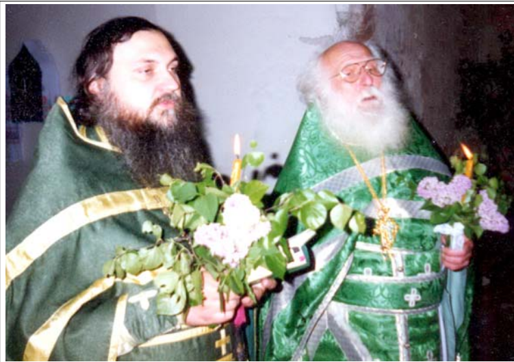
арх. Торнике в Никольском храме с. Васютино

находчивостью: для того чтобы своевременно узнать о смерти Сталина, он отдал все свои деньги водителю, приехавшему в лагерь — чтобы он привез ему водку, когда тиран умрет. И когда это произошло, он воскликнул: «Ребята! Сатана сдох!» — и свалился в обморок.