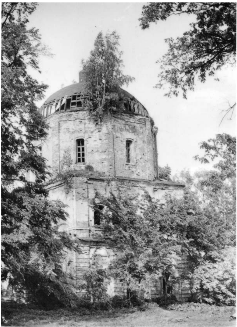
Руины Никольского храма с. Васютино 1989 г.

10 ноября 1937 г. отец Константин был допрошен начальником Павлово-Посадского отделения УНКВД Пелькеном и в течение 10 дней было сфабриковано дело, по которому отец Константин был обвинен в том, что «ведет систематическую антисоветскую агитацию», «сгруппировав вокруг себя контрреволюционный