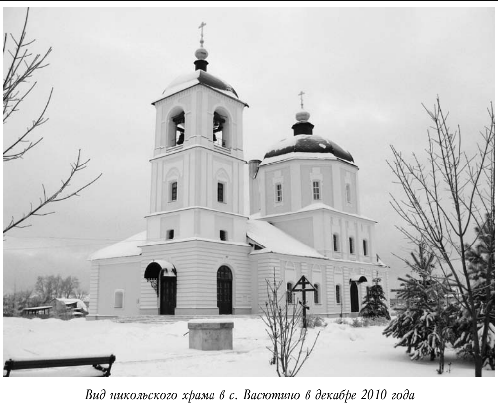
Вид никольского храма в с. Вастутино в декабре 2010 года

Один из вопросов на том дьявольском следствии по сфабрикованному против отца