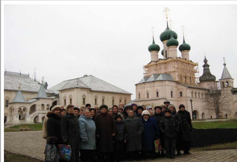
В Кремле (на митрополичьем дворе) Ростова Великого

Закончилась наша паломническо-историческая поездка в Переяславль Залесском. Мы поклонились честным мощам преподобного Никиты столпника, святого, который, подобно нам, многогрешным, был вспыльчивым и страстным человеком, который во обуздании страстей и об-