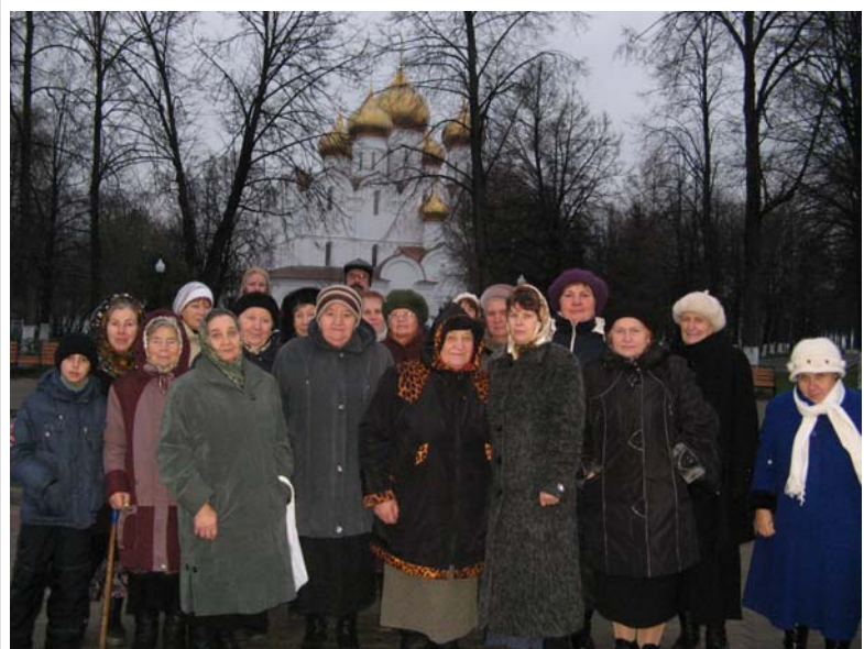
У новопостроенного кафедрального Успенского Собора г. Ярославля.