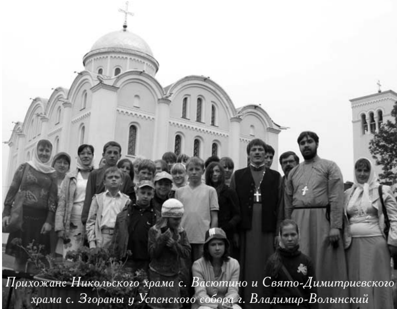
Прихожане Никольского храма с. Васютино и Свято-Димитриевского храма с. Згораны у Успенского собора г. Владимир-Волынский

щении; другой - собор Успения Пресвятой Богородицы строит великий князь в 992 г. и учреждает здесь епископскую кафедру. Освящен Храм был первым епископом Владимиро-Волынским Стефаном и служил усыпальницей удельных князей. Однако, от того древнейшего памятника Православия остались лишь частицы фундамента, теперь место это зовется «Старая кафедра». В 1160 году великий князь Мстислав Изяславич строит новый прекрасный храм и также посвящает его любимейшему на Руси празднику - Успению Богородицы. Здесь в 1170 году был похоронен и сам строитель, и с тех пор зовется храм Мстиславовым. Расположенный на самом высоком и красивом месте города, единственный из сохранившихся на Волыни со времен Киевской Руси, Свято-Успенский кафедральный собор и теперь предстает нашему взору во всем своем великолепии.