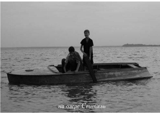
на озере Свитязь

объединившись с датскими, норвежскими и силами других северных частей Европы, с санкции римского папы и германского императора Фридриха II, начали захват славянских земель за Одером и в Балтийском Поморье. Одновременно велось наступление на земли прибалтийских народов (эстов и латышей), для захвата которых был специально создан в 1202 году орден меченосцев. Для завоевания Литвы и западных русских земель прибыли рыцари Тевтонского ордена. В 1234 году поражение от нов-