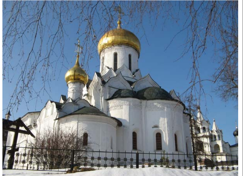
Собор Рождества Пресвятой Богородицы в Савво-Сторожевском монастыре

День Рождества Пресвятой Богородицы (8/21 сентября) – это еще и день Куликовской битвы. 8 сентября (старый стиль) 1380 г. на Куликовом поле русская рать одержала одну из самых главных побед за всю историю России. Значение Куликовской битвы не исчерпывается тем, что мы знаем о ней из учебников истории: положено начало освобождению Руси от татаро-монгольского ига; Москва подтвердила свое право быть центром собирания русских земель и т.д. Главная победа была одержана тогда не над коварным Мамаем, а над собственными грехами и пороками. На Куликово поле под знамена князя Дмитрия пришли русские князья, отложившие свои неумеренные личные амбиции, свои споры о «чести» и уделах; пришли воины, получившие умение воевать в бесконечных княжеских междоусобицах и братоубийственных войнах; пришли простые русские люди из разных городов, пришли, преодолевая естественный страх перед дотоле непобедимым врагом. Теми, кто сражался на Куликовом поле не могла двигать ни корысть, ни честолюбие, ни ожидания славы. Для каждого из них это была победа над собой. И победа эта была благословлена преподобным Сергием Радонежским.