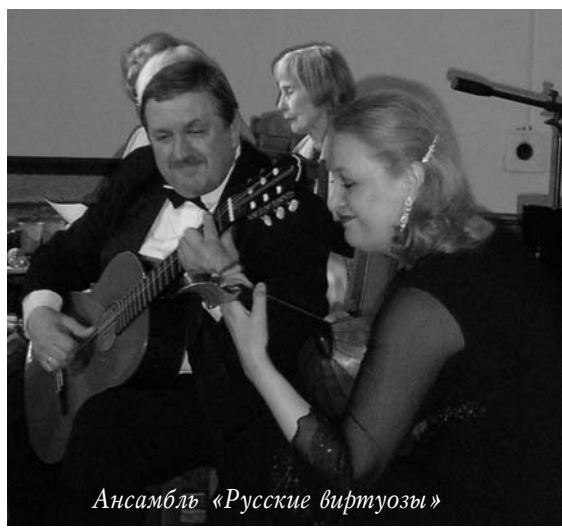
Ансамбль «Русские виртуозы»

Дождь пройдет — тогда иди! Пей озон. В омытых кущах — Слово Правды. Встреча-случай — Не случайный — впереди. Подожди же. Подожди.